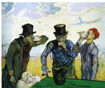
Vincent van Gogh I bevitori (o Le quattro età della vita) 1890 The Art Institute of Chicago