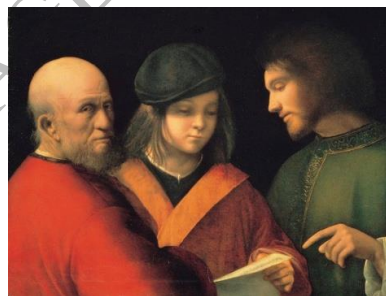
Giorgione Le tre età dell'uomo (o La lezione di canto) 1500-1502 Galleria Palatina – Firenze