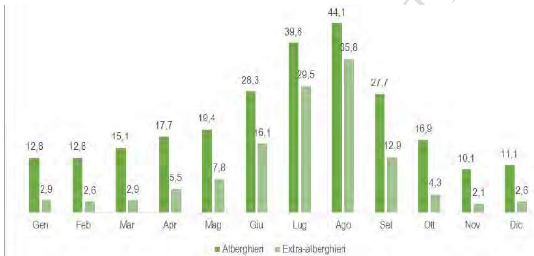
Graf. 36 – Presenze alberghiere ed extralberghiere nei vari mesi dell'anno 2012. Valori assoluti in milioni.

La distribuzione complessiva dei flussi nell'anno 2012 conferma una condizione strutturale del sistema di ospitalità del Bel Paese. Nei mesi estivi, da giugno a settembre, si concentra la massima affluenza dei clienti, con il 61,5% delle presenze e con punte di affollamento nei mesi di luglio (18,1%) e agosto (21,0%), tradizionalmente definiti di alta stagione turistica.