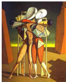
G. DE CHIRICO, Ettore e Andromaca , 1917