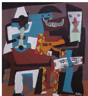
Pablo PICASSO I tre musicisti , 1921