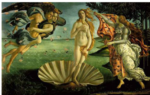
Sandro BOTTICELLI Nascita di Venere , circa 1482-85